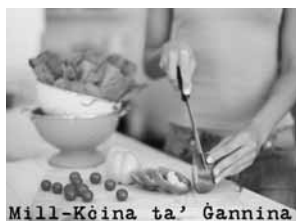
Mill-Kċina ta' Ġannina

Din hija sensiela ta' 10 programmi. Fost l-oħrajn tingħata informazzjoni dwar ir-relazzjoni tagħna mal-ikel, valuri nutrittivi, l-importanza tal-eżerċizzju, l-istorja tal-ikel matul iż-żminijiet kif ukoll informazzjoni l-aktar riċenti mid-dinja kulinarja. Matul il-programm jingħataw ukoll riċetti sajjfin b'ingredjenti u prodotti imkabbra lokalment tal-istaġun għal-okkażjonijiet differenti. Ir-riċetti li jingħataw waqt il-programm jistgħu jinkisbu minn fuq il-paġna tal-facebook ta' Radju Lehen il-Qala jew inkella jingabru personalment mill-istazzjon tar-radju. Programm li jikkuntenta lil aptit ta' kull min jaf jiekol tajjeb għal saħħtu u għal qalbu.