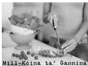
Mill-Kċina ta' Ġannina

Din hija sensiela ta' 10 programmi. Fost l-oħrajn tingħata informazzjoni dwar ir-relazzjoni tagħna mal-ikel, valuri nutrittivi, l-importanza tal-eżerċizzju, l-istorja tal-ikel matul iż-żminijiet kif ukoll informazzjoni l-aktar riċenti mid-dinja kulinarja. Matul il-programm jingħataw ukoll riċetti sajjfin b'ingredjenti u prodotti imkabbra lokalment tal-istaġun għal-okkażjonijiet differenti. Ir-riċetti li jingħataw waqt il-programm jistgħu jinkisbu minn fuq il-paġna tal-facebook ta' Radju Lehen il-Qala jew inkella jingabru personalment mill-istazzjon tar-radju. Programm li jikkuntenta lil aptit ta' kull min jaf jiekol tajjeb għal saħħtu u għal qalbu.